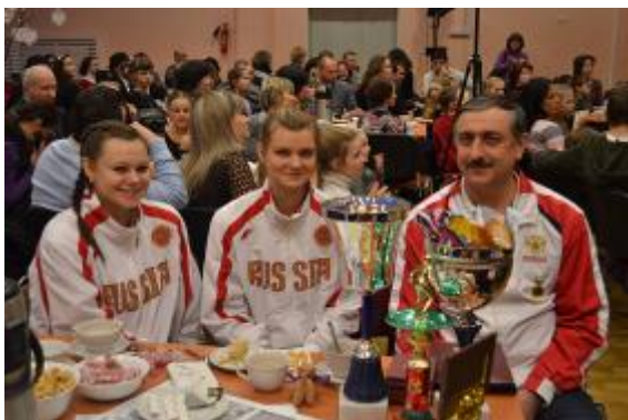
18 февраля 2012 года. Встреча Родительского клуба «ДИВО» по теме «Отцы и дети»