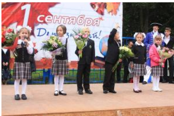
1 сентября 2011 года. День Знаний