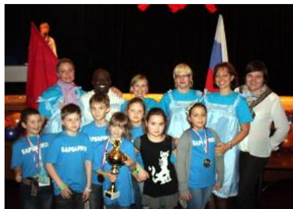
21-27 апреля 2012 года. XX Фестиваль «Еврофест» («Одиссея Разума»)