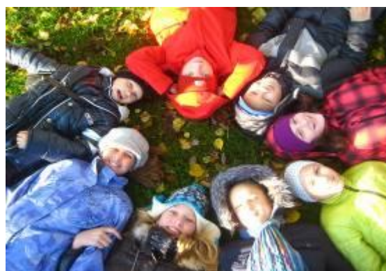
10-17 октября 2011 года. Участие группы учащихся и учителей в работе English Language camp (г.Карьяа, Финляндия)