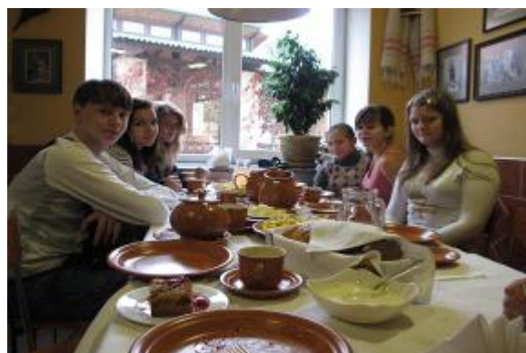
20-24 октября 2011 года. Образовательное путешествие лауреатов конференции «Многогранная Россия» в Белоруссию