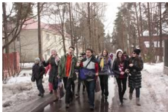
3 апреля 2012 года. Выезд школьного актива «Команда. Лидерство. Успех»