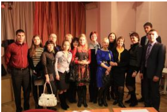
8 ноября 2011 года. Межрегиональный семинар «Молодые – молодым»: встреча молодых педагогов Санкт-Петербурга, Новосибирска и Великих Лук