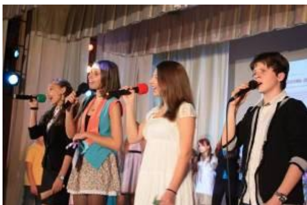
15 октября 2011 года. Клуб интересных людей на тему «Открытие Космоса человеческого Я»