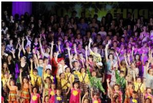
19 мая 2012 года. Церемония «Золотые достижения» и гала- концерт в честь 15-летия школы (СПб «Мюзик-холл»)