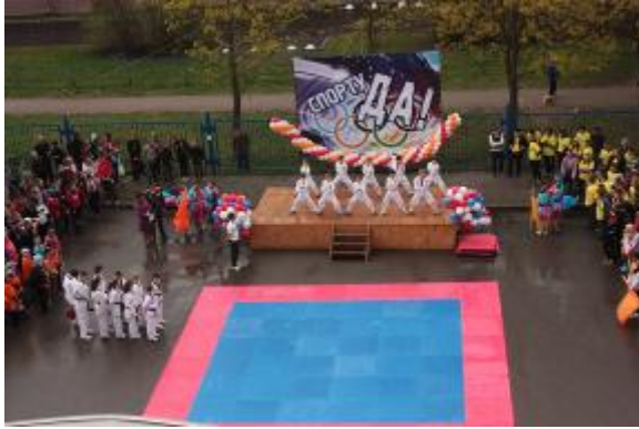
12 мая 2012 года. II олимпийские игры ОУ МО №21 на базе школы №619