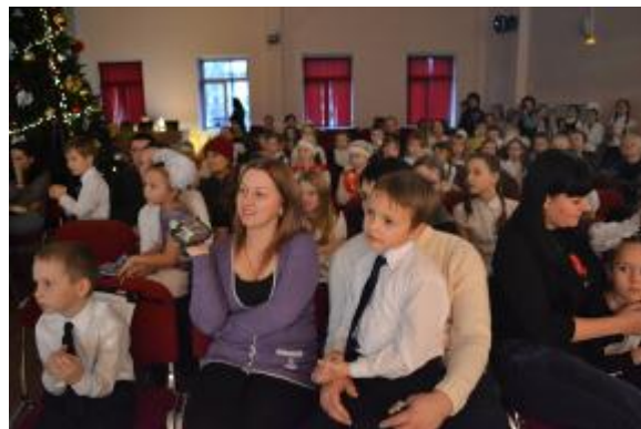
8 декабря 2011 года. Районный конкурс «Маленькие звездочки»