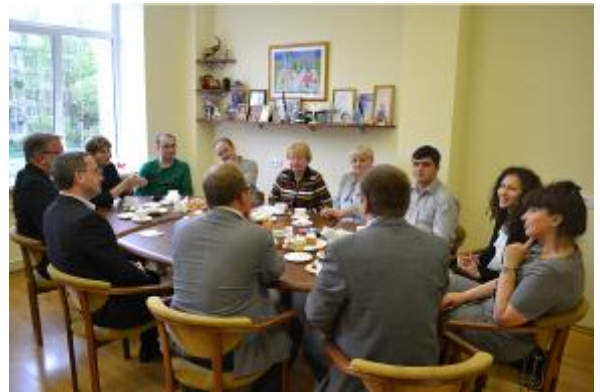
18-19 мая 2012 года. Визит в школу группы работников системы образования Финляндии и Департамента образования Новосибирска