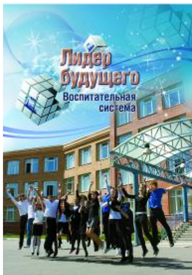
Январь 2012 года. Победа школы в V всероссийском конкурсе воспитательных систем (482 участника; 12 лауреатов)