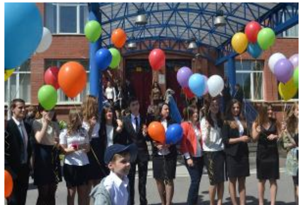
25 мая 2012 года. Праздник «Последний звонок» для учащихся 9 и 11 классов