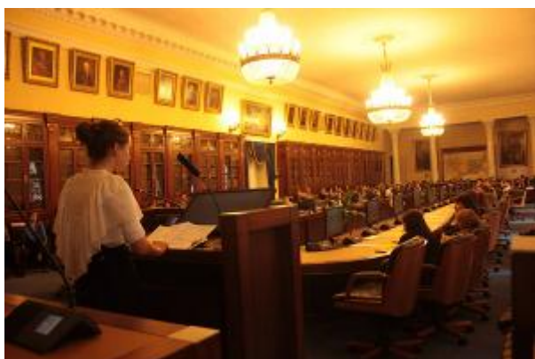
21 апреля 2012 года. VII конференция школьников «Многогранная Россия» в НМСУ «Горный»