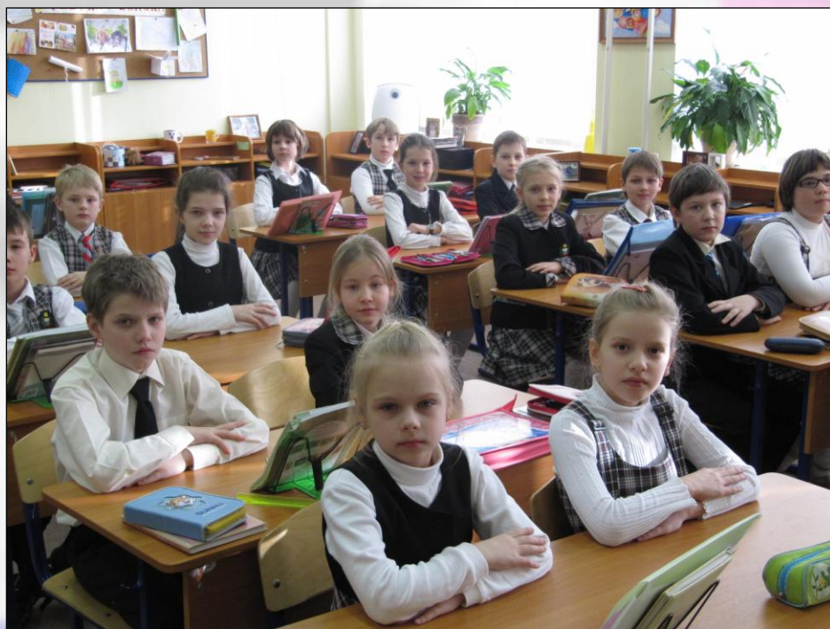
класс в школьной форме