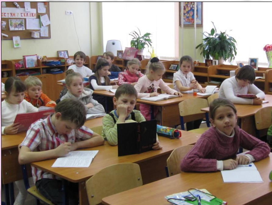
класс без формы